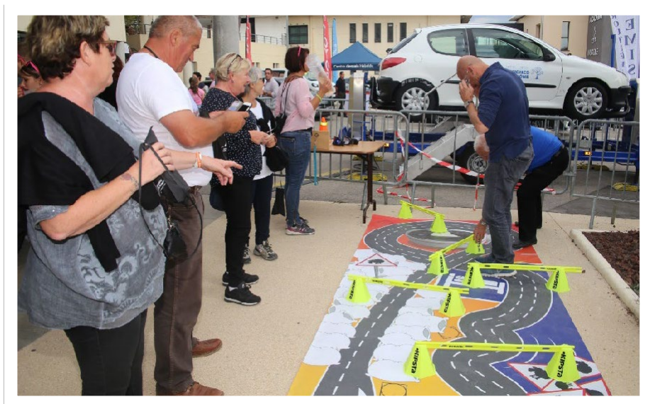
Animations sécurité routière