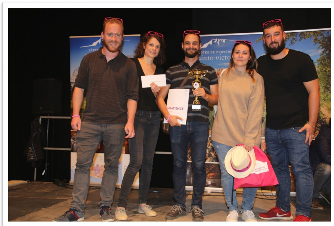
Grande équipe gagnante du Rallye 2019