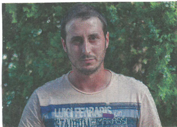
Vignerons du Baou

L'hebdo des agricultures méditerranéennes